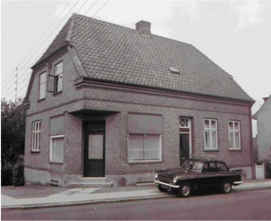
Foto: Historisk billede af ejendommen fra 1960'erne.