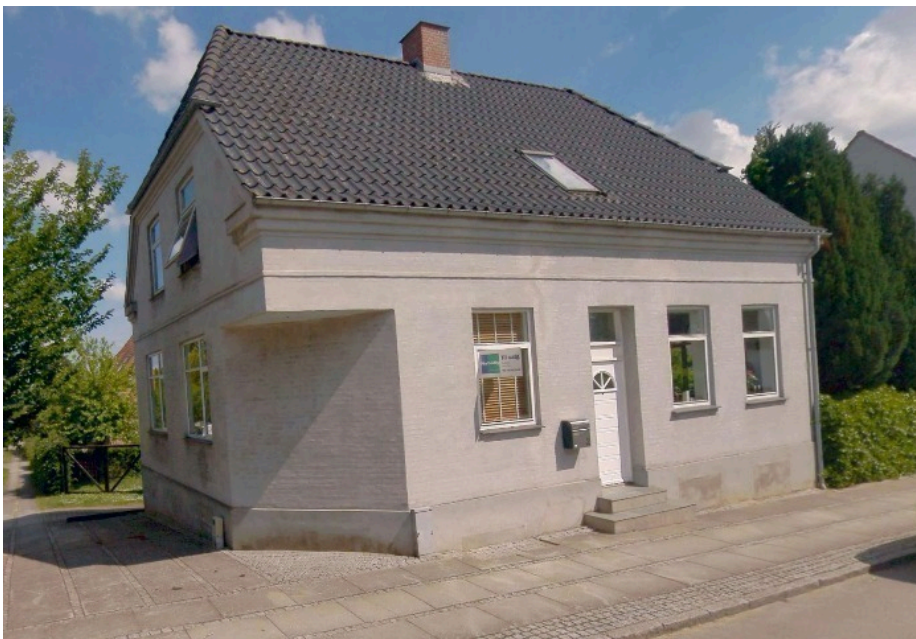
Foto: Ejendommen i dag.