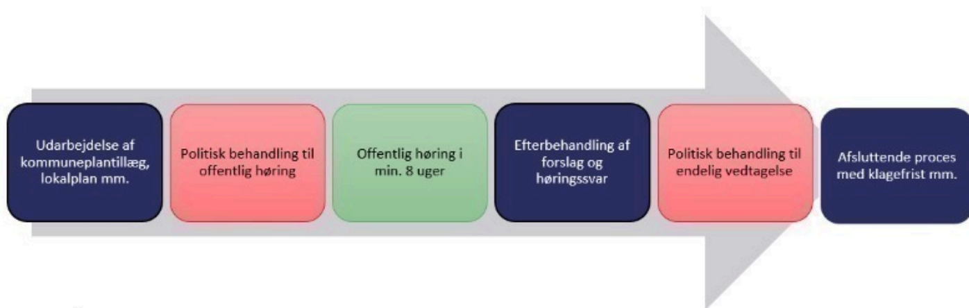
Figur 2. Proces efter politisk igangsætning. Rød indikerer politiske vedtagelser, grøn inddragelse af berørte borgere og lokalsamfund

Illustrationerne er principskitser, der viser de væsentligste overskrifter igennem planlægningsprocessen. Planlægning er sjældent en lineær proces, hvorfor der undervejs vil være spring frem og tilbage mellem overskrifterne vist herover.