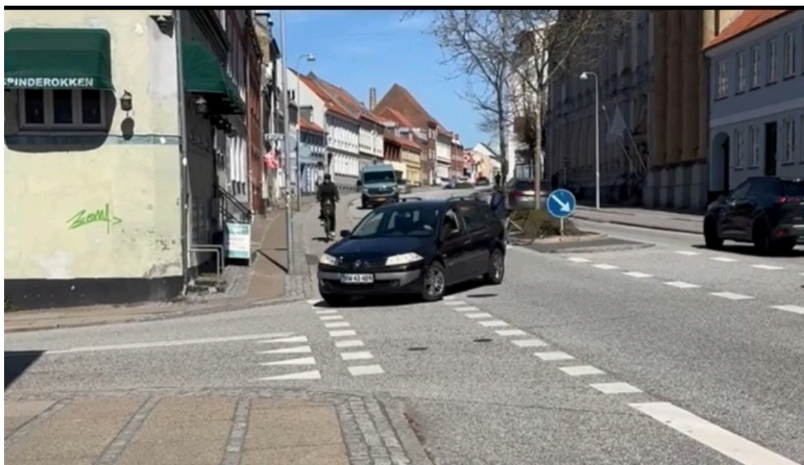
Billede 1: Situation med cyklist og højresvingende bilist på Allegade (23. april 2026 kl. 12.45)

Et uheld er en cyklist, som overses af venstresvingende bil fra Allegade. Vurderingen er, at bilister kan føle sig presset af biler bagfra og derved forcere svingningen, hvorved de ikke får foretaget den nødvendige orientering, hvor cyklister kommer med høj fart ned ad bakken.