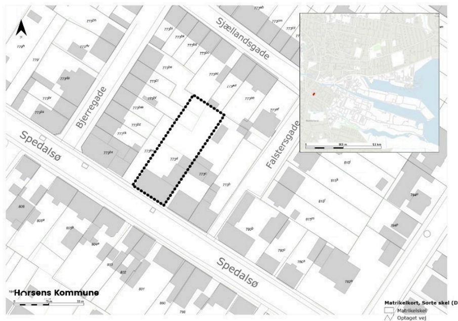
Figur 1, oversigtskort med markering af Spedalsø 23, 8700 Horsens

Samlet fremstår bygningen som et repræsentativt eksempel på et byhus fra Horsens købstad i begyndelsen af 1900-tallet og bidrager væsentligt til områdets kulturhistoriske helhed.