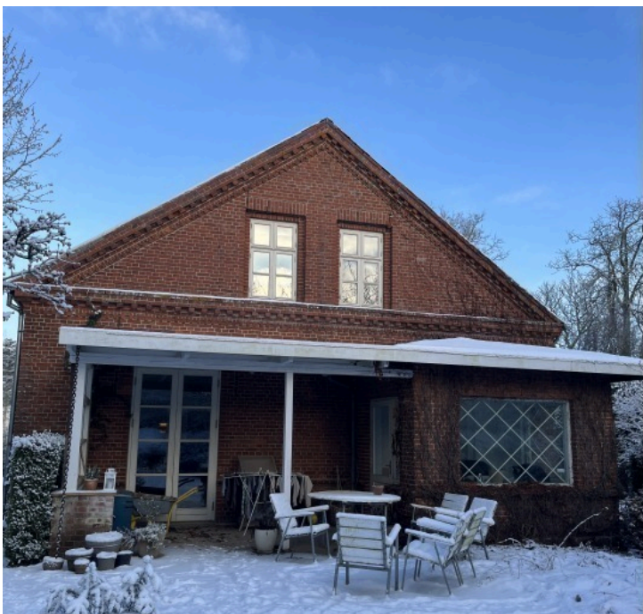
Fotos af ejendommen i dag.