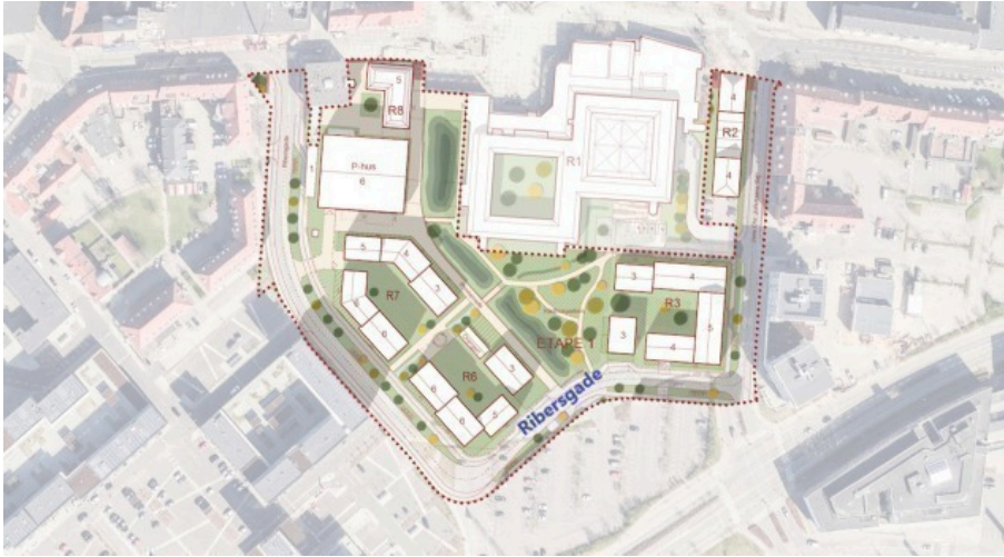
Figur 1. Oversigtskort over omlægningen af Ribersgade