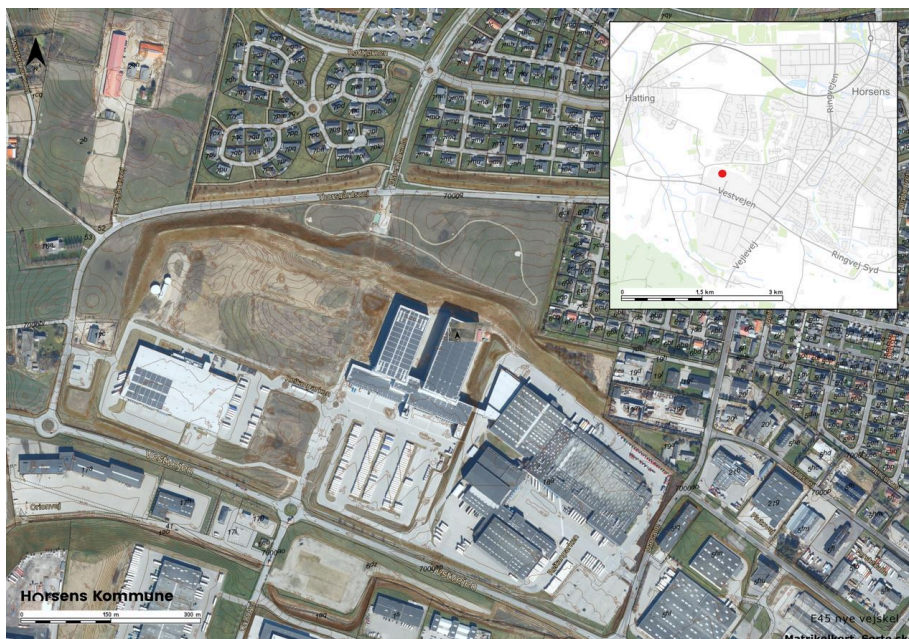
Fig. 1. Oversigtskort over REMA i Erhvervsområde Horsens Syd

Behovet for masten og mastens landskabelige konsekvenser blive undersøgt yderligere, inden det besluttes, om telemasten skal indgå i lokalplanen.