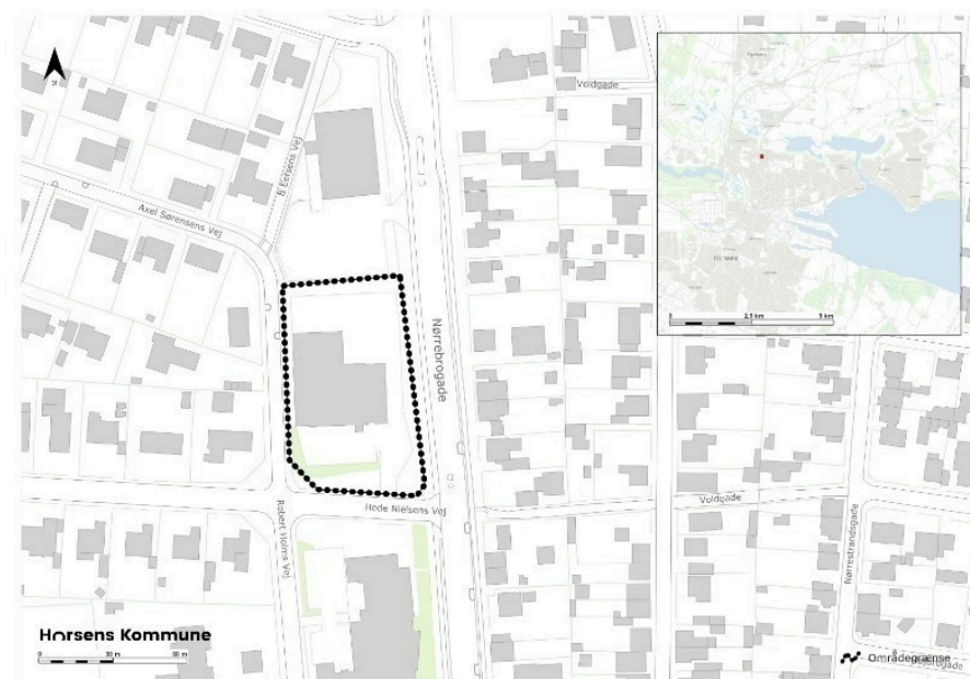
Figur 1. Oversigtskort, lokalplanafgrænsningen for området