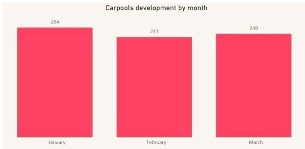
Figur 1. Antal samkørsler med Nabogo pr. måned, 2025

Der ses fortsat en spredning i, hvor i kommunen samkørslerne finder sted. Dog er Horsens by fortsat udgangspunkt for flest samkørsler, idet flest samkørsler enten starter eller ender i Horsens by.