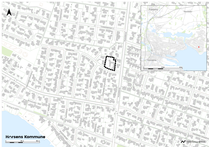
Figur 1, oversigtskort med markering af Højagervej 2, Horsens